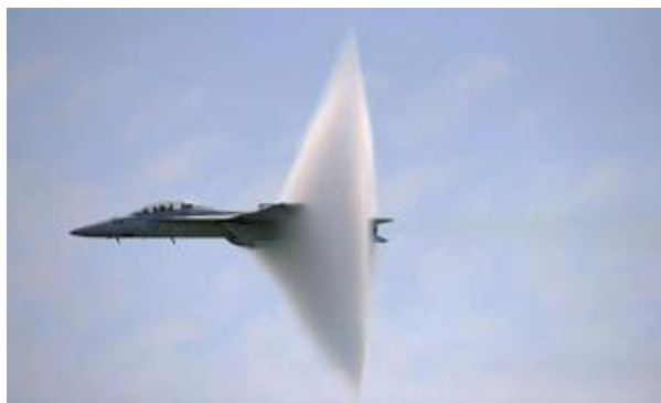
Slika 1.43 – Oblak kondenzovane vodene pare iz vazduha koji se može videti oko aviona koji leti nadzvučnom brzinom

Zvučni prasak koji slušalac čuje na zemlji prilikom preleta „nadzvučne“ letilice se često, pogrešno, naziva „proboj zvučnog zida“. Zbog toga ovde treba naglasiti da proboj zvučnog zida ne postoji kao fizička pojava, već je popularni naziv za prelaz iz leta podzvučnom u let nadzvučnom brzinom. Izraz je čudna kombinacija termina zvučna barijera ( sound barrier ) i zvučni prasak ( sonic boom ), nastao u vreme kada je pred konstruktorima i proizvođačima aviona postojao veliki broj tehničkih i tehnoloških prepreka (barijera) koje je trebalo savladati da bi avioni leteli nadzvučnim brzinama.